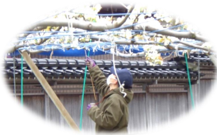
(写真: 梨の受粉作業 サポーター活動)

今回は、農業サポーターを目指す方を募集しますので、あなたも講座や実践研修を通して栽培に関する知識を深めながら農業サポーターとして活躍してみませんか。